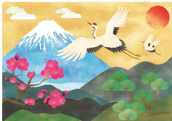
1月23日「123の日」のノベルティ例 ちぎり絵