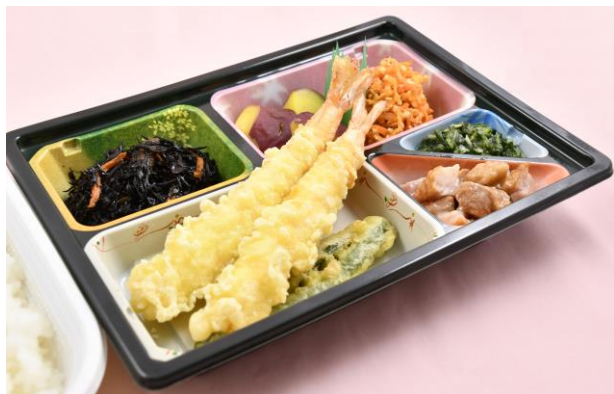
行事食の例 車海老の天ぷら弁当