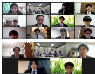
各大学との打合せの様子

「大学生対抗 IR プレゼンコンテスト」は、学生の金融リテラシー向上をコンセプトに組織された学生投資連合 USIC に所属する大学の各投資サークルが、上場企業の企業概要・成長の魅力を取材、研究し発表するイベントです。1 チームが上場会社 1 社を担当し、企業へ取材を行います。IR 資料の研究を通じ、事業・業界・業績分析や企業の強みやリスク等を、各社の IR 担当者に代わって発表し、審査員による評価で順位を競います。