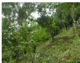
アドプトフォレスト天見