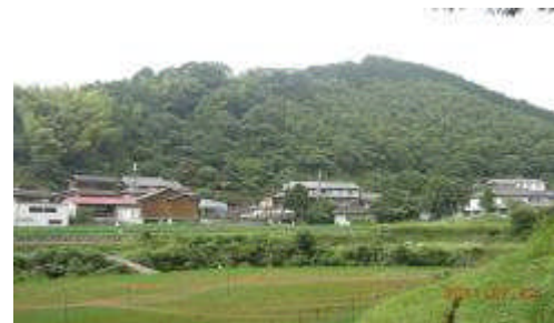
河内長野の里山風景