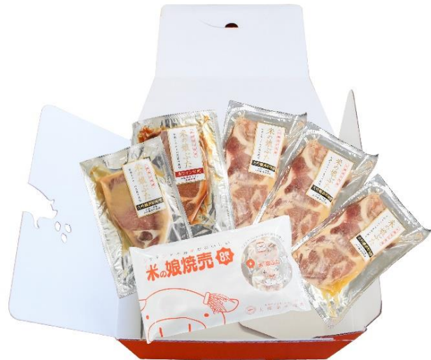
『敬老の日 元氣 BOX』(3,560円 税込)

『敬老の日 元氣 BOX』は、「米の娘ぶた焼売」(8個入り1パック)と、「米の娘ぶたローズ赤ワインみそ漬け」(100g1枚)、「米の娘ぶたローズ大吟醸酒粕味噌漬け」(100g1枚)、「米の娘ぶた」の柔らかい部分を厳選したモモ(120g×3PK)で作った味噌漬けをセットにし、元氣がでるオレンジカラーのギフトボックスでお届けする、贈り物におすすめの新商品です。