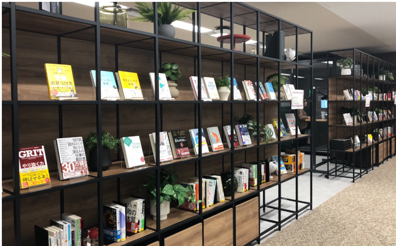
ライブラリの写真