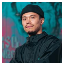
河村良彦選手 グレイクダンス世界王者