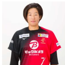
上野由岐子投手 ビックカメラ高崎