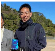
秋山翔吾選手 広島東洋カープ