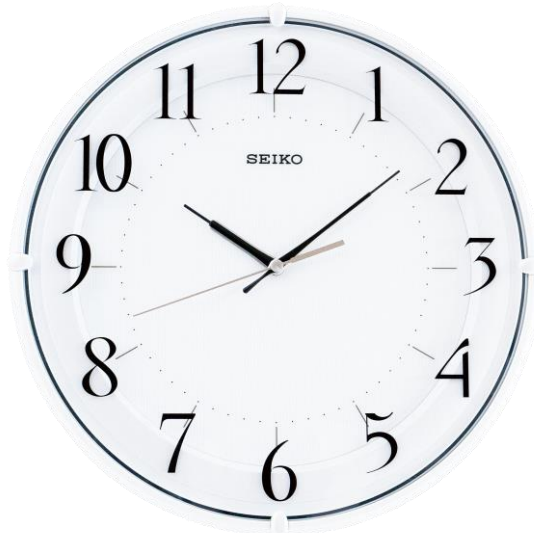
NTP クロック NCA-3012

セイコーソリューションズ株式会社（代表取締役社長：関根 淳、本社：千葉県千葉市、以下セイコーソリューションズ）は、施設内の時計をシステム時刻と同期するネットワーク型時計 NTP クロックの無線 LAN モデルのラインアップに、コストパフォーマンス向上と軽量化を実現させた新製品「NCA-3012」を追加し、2025年1月より販売を開始いたします。