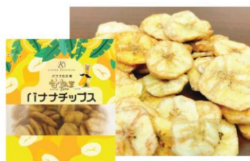
おすすめ キタノセクション 甘熟王バナナチップス