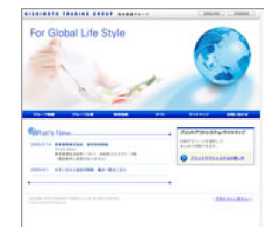
西本貿易様 企業サイト