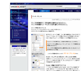
ウェブクエスト様 企業サイト