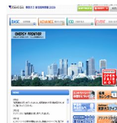
東京ガス様 新卒採用サイト