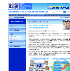
なおしや又兵衛様 企業サイト