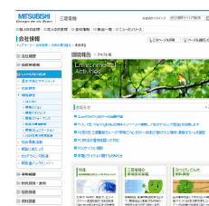
三菱電機様 企業サイト