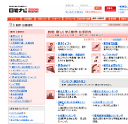
日経ナビ様 採用サイト