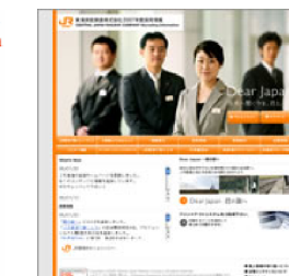
JR東海様 採用サイト