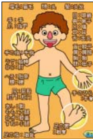
役立ちツール (人体図)