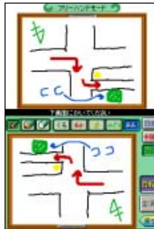
フリーモード (メモ書きに便利)