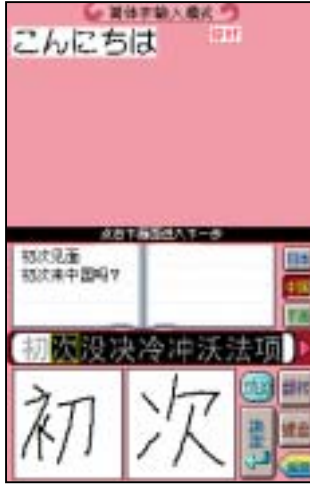
日本語→中国語入力画面