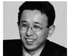
ヤフー株式会社 ビジネスサービス本部 開発部 部長

ネットショップ初心者から上級者まで、絶対に満足できる セミナーとなっております。是非、ご参加ください!