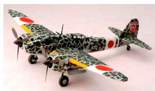
ニチモ 1/48 二式複座戦闘機屠龍丙型改造甲型