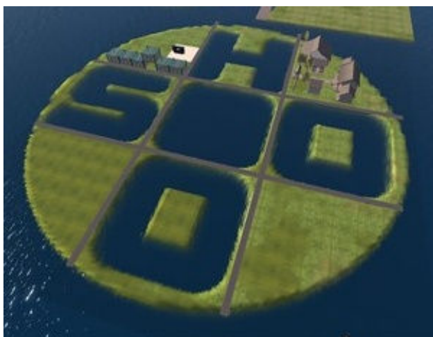
SOHO の文字を模った SIM の全景

http://slurl.com/secondlife/SOHOstyle/88/154/21