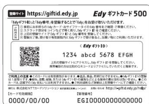
Edy ギフトカード(裏面)