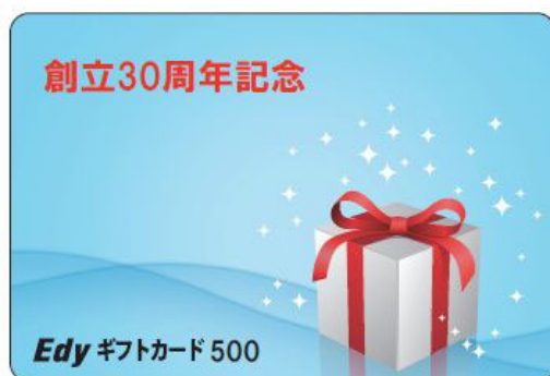
Edy ギフトカード(表面)