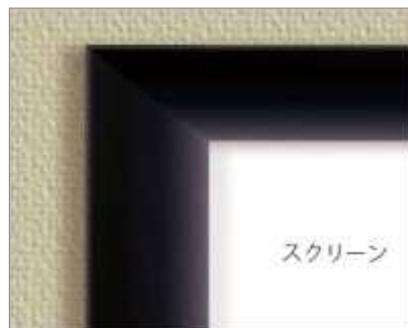
フロッキーフレーム