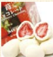
果実の贈物 苺チョコレート ¥630