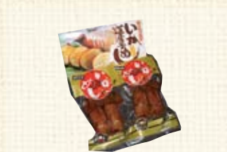
道産子いかめし (4尾セット) ¥1,800