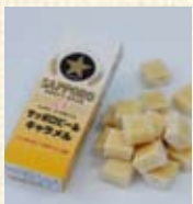
サッポロビールキャラメル ¥157