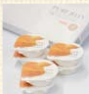
夕張メロンピュアゼリー (6個入) ¥1,260