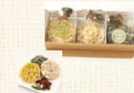
北海道パスタ ベベロンチーノセット (3個入) ¥1,500