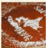
焼きプリンケーキ ¥840