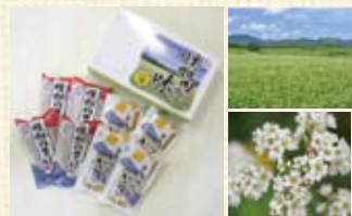
日本一のそば産地・幌加内町 半生そば (240g入) ¥400 風神そば (200g入) ¥300