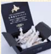
北海道生キャラメル ¥1,050