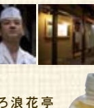
北海道黒松内町 「北限のブナ林」の ナチュラル・ミネラルウォーター