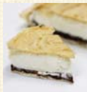
ハピネスデューシーソフトもなか (1個) ¥300