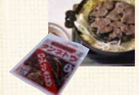
タンネットウロースジンギスカン (500g入) ¥850