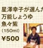
星澤幸子さんが選んだ 万能しょうゆ 魚々紫 (150ml) ¥500