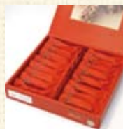
とうきびチョコレートハイミルク ¥1,100