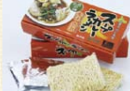
カレー・ワールド・スープカレーラーメン (2食入) ¥682