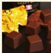
サッポロビールチョコレート ¥525