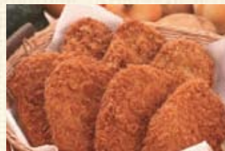
くりやまコロッケ (5ヶ入) ¥500 ポテト、ピーフ、かぼちゃ、カレー各種