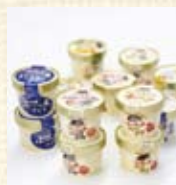
あいすの家・アイス (各種1個) ¥300