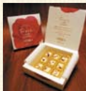
ローズホワイトチョコレート ¥840