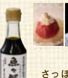
さっぽろ浪花亭 トマトの三杯酢 (300ml) ¥525