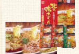
北の味めぐり・寒干しらーめん (12食入) ¥2,100