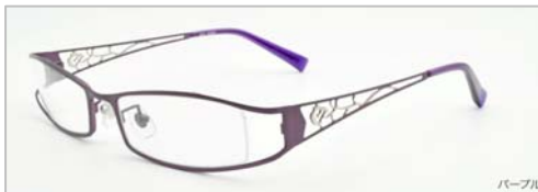
左：従来の老眼鏡 右：i4U の老眼鏡

従来の既製老眼鏡は、昔の高齢者を対象にしたフレームデザインがほとんどで、今のおしゃれな中高年のデザインニーズにあった老眼鏡が少ない。