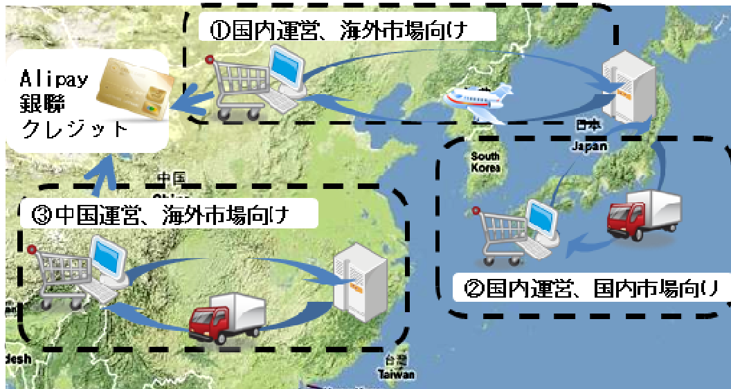
【図 販売パターン概要図】