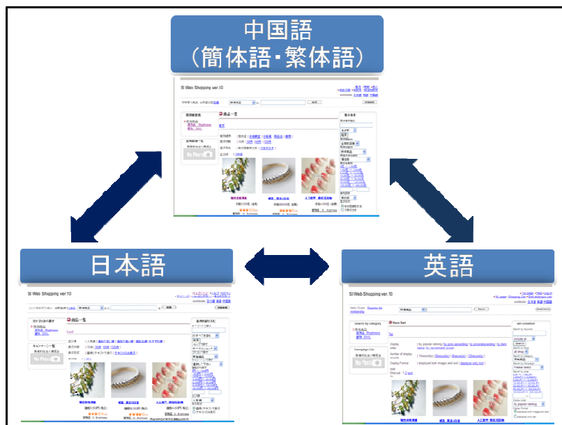
【図 言語切り替えイメージ】

お客様は、ホームページの 日本語 、 English 、 簡体字 、 繁体字 、という言語選択により、サイトや商品情報を切り替え表示できます。