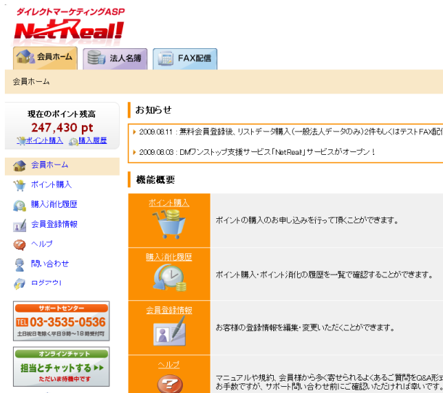
会員画面サンプル