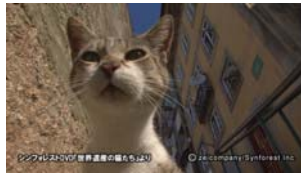
Chap.2 ポルト(ポルトガル)よ り