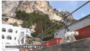
Chap.7 アマルフィ(イタリア)よ り