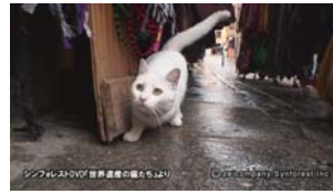
Chap.3 トレド(スペイン)より