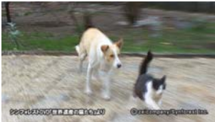
Chap.6 コトル(モンテネグロ) より