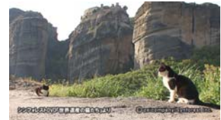
Chap.11 メテオラ(ギリシャ)より