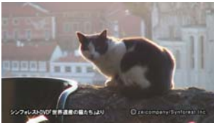
Chap.1 リスボン(ポルトガル) より