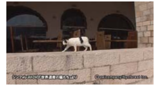
Chap.5 ドゥブロヴニク(クロアチ ア)より