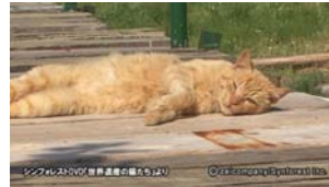
Chap.10 コルフ島(ギリシャ)よ り