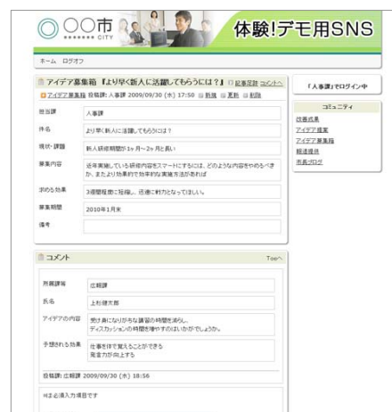
▲「アイデア募集箱」サンプル画面