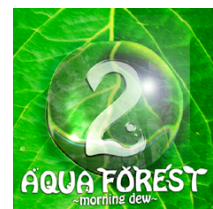
App Store や iPhone/iPod touch 上に表示されるアイコン