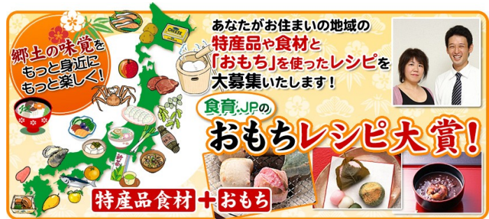
特産品を使ったおもちレシピを広く募集