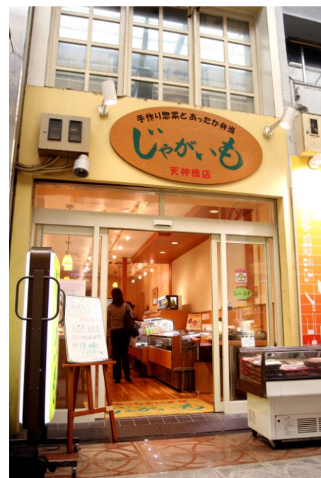
「お惣菜 じゃがいも」