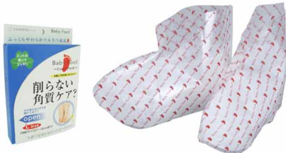
(ベビーフット イージーパックSP Lサイズ)