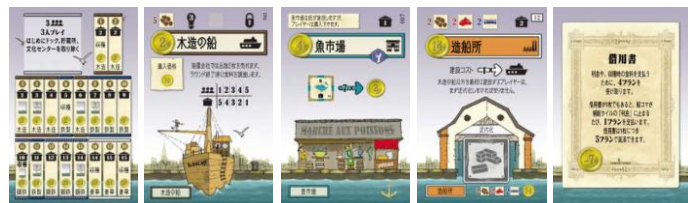
上記カードは商品構成上の一部です