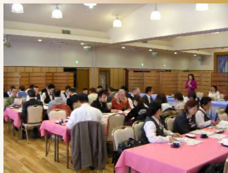
実際の勉強会風景