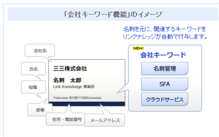
「会社キーワード機能のイメージ」