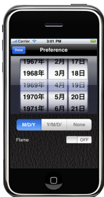
仮想撮影日の設定