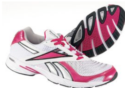
ホワイト/ブリリアントピンク/シルバー/ブラック