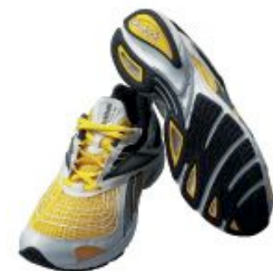
ホワイト/コメット/グラベル