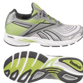
ホワイト/シルバー/キウィグリーン