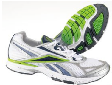
ホワイト/シルバー/ ブルーキャデット/アシディックグリーン