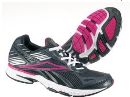
ラベル/ホワイト/ブリリアントピンク/シルバー