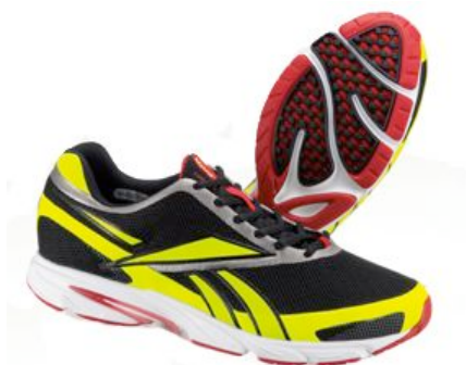
UNISEX(23.0cm – 28.0cm) ブラック/シトロン/レッド