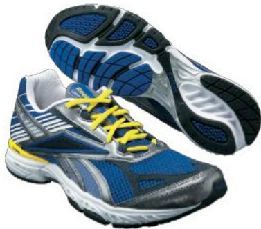
ウルトラマリン/ネイビー/ピュアウォーター/ ホワイト/コメット