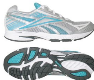
シルバー/グレイシャープブルー/ホワイト