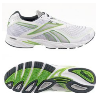
ホワイト/シルバー/アシディックグリーン/グラベル