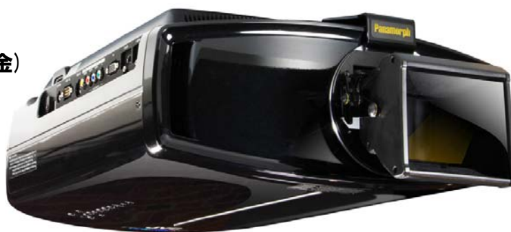
ビクタープロジェクターに取り付けた FVX200J