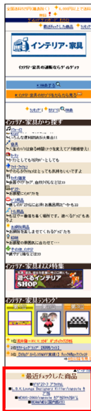
図 3:カテゴリページでの利用