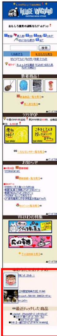
図 2:トップページでの利用