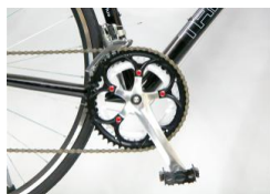
スクリューキャップ