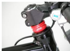
コラムスペーサー