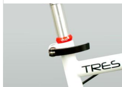
シートポストリング