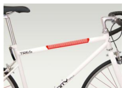
フレームプロテクター