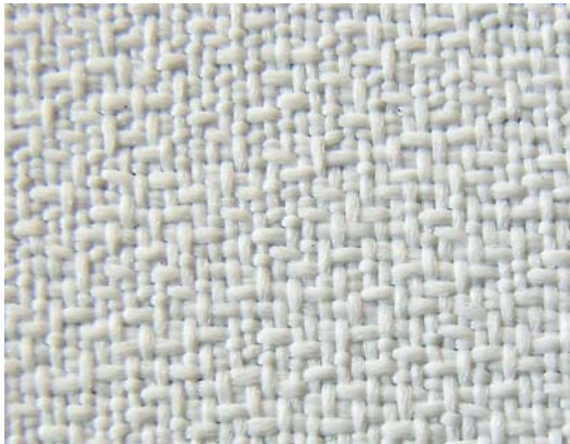
WF203のランダム織り（拡大写真）