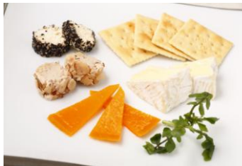
チーズ盛り合わせ