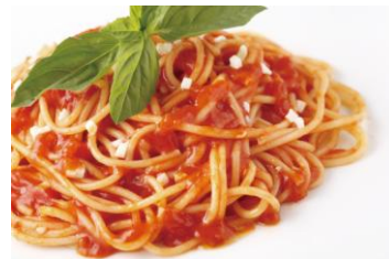
モッツアレラ&トマトソースパスタ