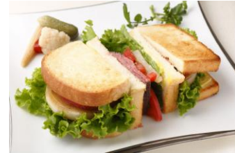
ローストビーフサンド