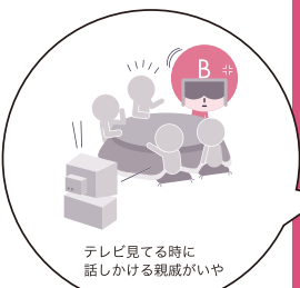
テレビ見ている時に話しかける親戚がいや それぞれの血液型の性格・特徴をイラストでユーモラスに表現。

月のスケジュールが一目でわかる、マンズリータイプを採用。見やすく書き込みやすいカレンダーに、それぞれの血液型のキャラクターを登場させ、単調になりがちなスケジュール欄を楽しく彩ります。