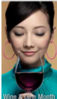
Wine & Dine Month