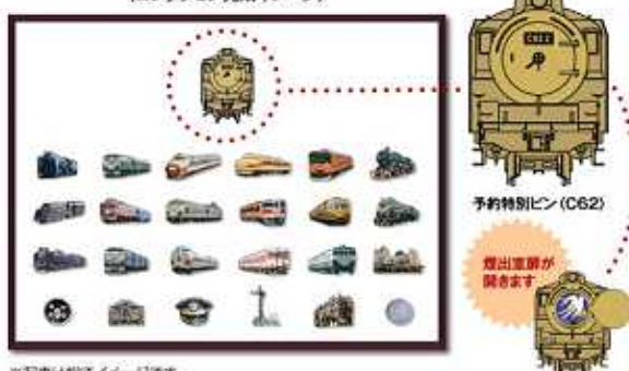
〈コレクション完成イメージ〉