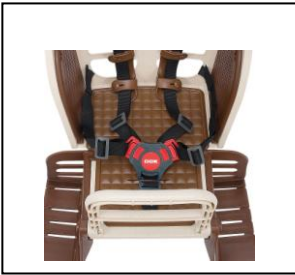
5点式シートベルトで しっかりロック