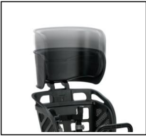
スライド式で簡単に 高さの調整が可能