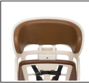
頭部まで守る ワイドヘッドレストで安全