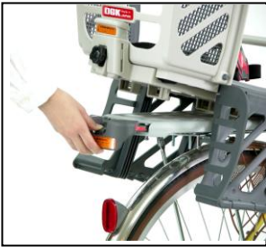
安全・正確に取り外し 可能な着脱式