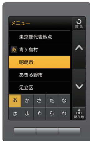
索引メニュー (イメージ)