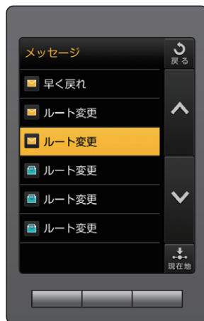
メッセージ機能 (イメージ)