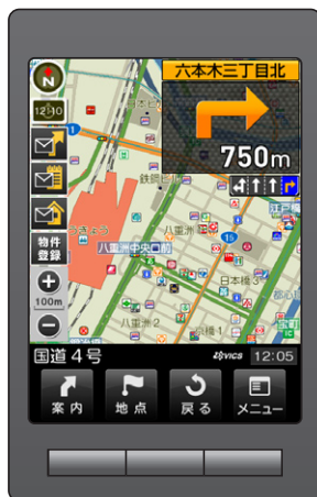
ナビゲーション中画面 (イメージ)