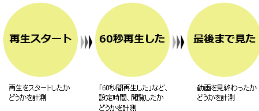
図3: 本機能で計測可能なイベント

また、動画の再生スタート、設定時間までの再生、完了の回数は、流入経路別に一覧化して見るができます。さらに、ユーザごとに動画の再生時間も計測することも可能です。