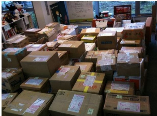
オフィスは届けられた絵本でいっぱいとなりました