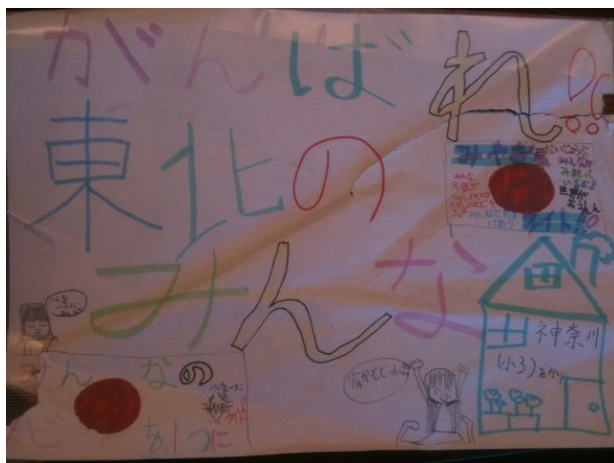
皆様から寄せられたメッセージの一例です