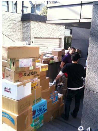
ビル入り口に積み上げられた寄付本の山