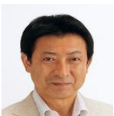
塩崎 恭久： 衆議院議員、元官房長官、日本銀行出身