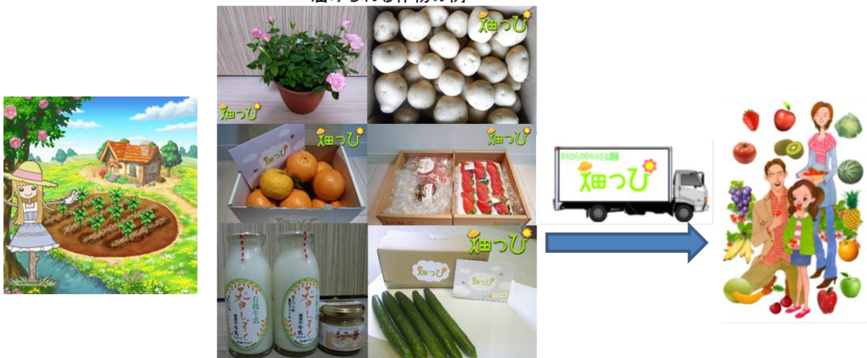
届けられる作物の例

「畑っぴ」は「水をやる」「肥料をやる」といった画一的な作業ではなく農家の方々に監修いただいた本格的な農作業の工程をゲーム化しております。仮想（バーチャル）農園で野菜や果物、牛などを育て、収穫・搾乳すると、本物の作物や乳製品が自宅に届くという画期的なサービスにより広い年代の方にご支持いただいております。