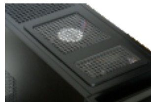
システム静音ファン