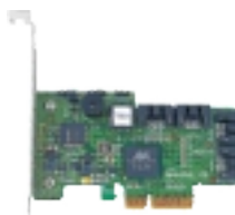
ARR-1430SA SATA RAID HBA