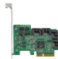
RR-2640X4 SAS/SATA RAID HBA