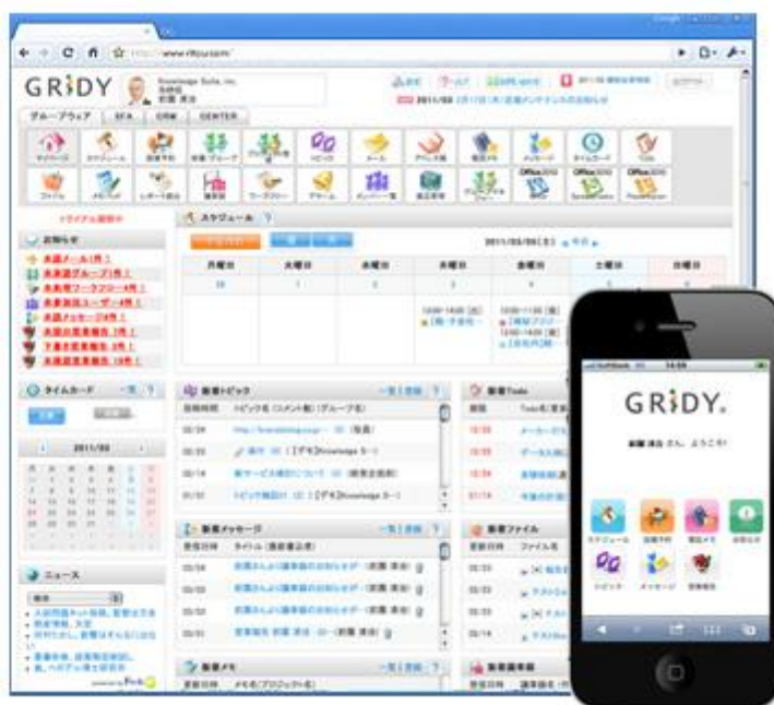
GRIDYグループウェアポータル画面