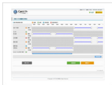
▲月別シフトの編集画面