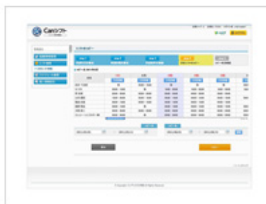
▲月別シフトコピー画面(2)

「Can シフト」は、「簡(can)単に管 (can) 理ができる(can)」をキーコンセプトにした情報サービス業（小中規模のコンタクトセンターや BPO 事業者）向けに開発された SaaS 型のシフト管理システムです。