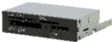
3.5"ベイ USB接続メディアリーダ FA406(B)