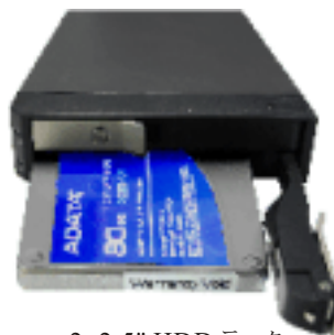
2x2.5" HDD ラック Insta STOR IS12TB