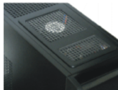
システム静音ファン