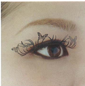
ピーコック peacock(孔雀1ペア)