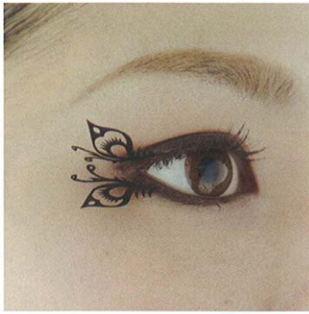
スモールピーコック small-peacock(孔雀小2ペア)