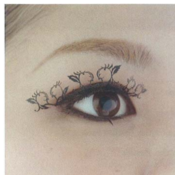
ピーチブラッサム peach-blossoms(桃の花1ペア)