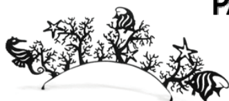
Under the sea(フルサイズ)