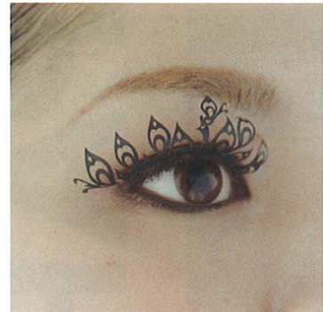
ピーコック peacock(孔雀1ペア)