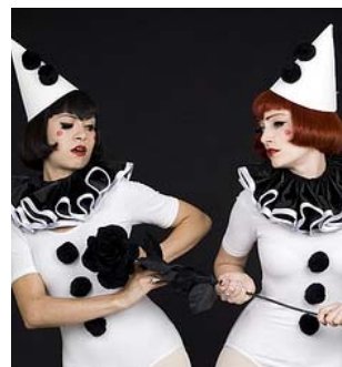
The Broken Hearts

※PAPERSELFの装着方法また他ラインナップに関しては次項よりご参照下さい。