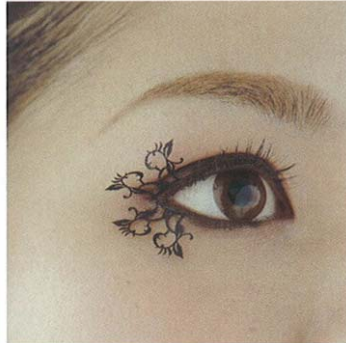
スモールピーチブラッサム small-peach-blossoms(桃の花小2ペア)