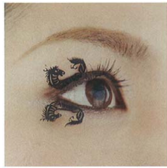
スモールホースポニー small-horses-pony(馬2ペア)