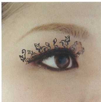
ピオニーズ peonies(牡丹1ペア)