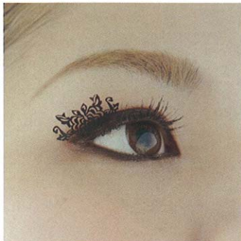
スモールピオニーズ small-peonies(牡丹小2)