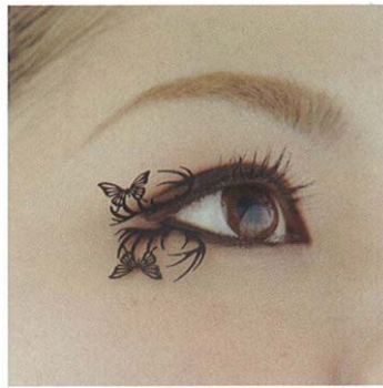
スモールディア&バタフライ small-deer & butterfly(鹿&蝶2ペア)