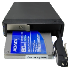
2x2.5" HDD ラック Insta STOR IS12TB