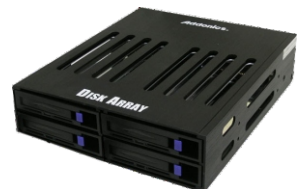
4x2.5" HDDラック DiskArray 4SA