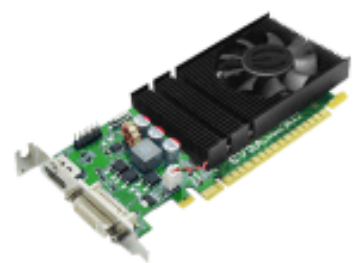
GeForce GT430 グラフィックス・カード