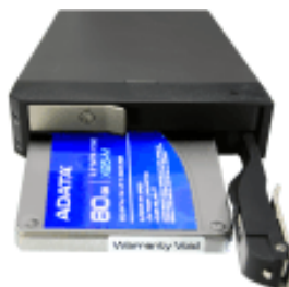
2x2.5" HDD ラック Insta STOR IS12TB